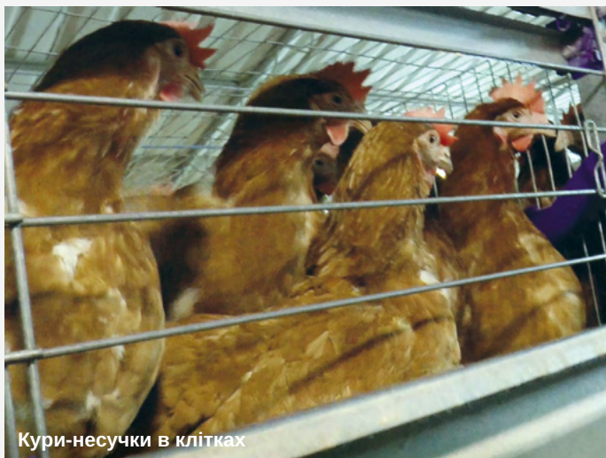
Кури-несучки в клітках